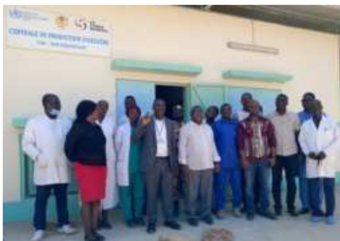
Visite de l'usine de production d'oxygène mis en place par le Ministère de la Santé Publique, avec l'appui de l'Organisation Mondiale de la Santé (OMS) et le Fond Mondiale .