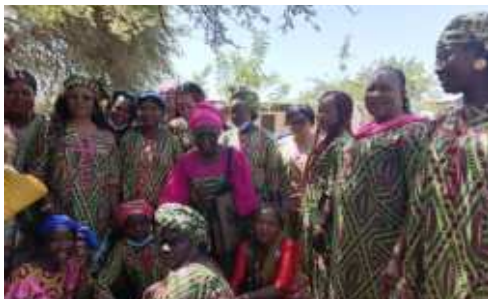
Célébration de la SENAFET par les femmes du CHU-BS