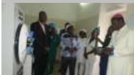
L'Archevêque métropolitain de N'Djamena bénit les nouveaux équipements de stérilisation.