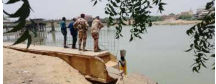
Visite du génie militaire de l'armée française pour s'enquérir de l'état de dégradation de la berge