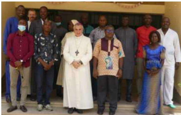
Photo de famille lors de la visite du Nonce apostolique du Tchad et en RCA au CHU-BS

Tout au long de l'année nous essayons d'organiser des campagnes pour permettre aux personnes les plus démunies d'avoir accès non seulement aux soins mais aux soins spécialisés tels que les soins dentaires et ophtalmologiques. Nous songeons à terme d'étendre ces caravanes gratuites dans d'autres secteurs spécialisés à l'instar de la gynécologie et de la pédiatrie.