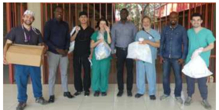
Photo de famille de l'équipe des chirurgiens coopérants chiliens, avec le staff administratif du CHUBS