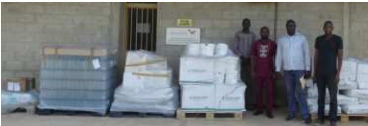
Réception des intrants de production des solutés pour le Laboratoire galénique

Le Dicastère pour le développement humain et intégral (Vatican) a accordé une subvention pour la relance du Laboratoire galénique. D'où la reprise de la production des solutés (dans leurs variétés), de la bétadine et bientôt la production de l'eau de javel, du savon liquide nécessaires aux besoins de l'hôpital.