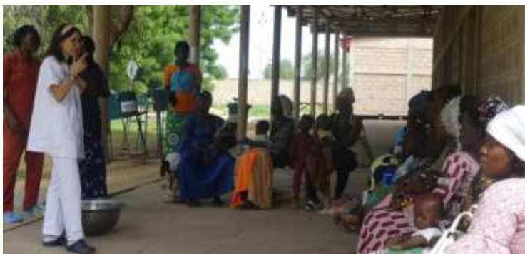
Séance de sensibilisation des femmes sur la malnutrition par une Coopérante médecin nutritionniste espagnole de l'Université de Lleida lors de son séjour au CHU-BS

L'un des points faibles de notre contexte reste la raréfaction des ressources parce que les besoins sont illimités mais les ressources sont rares et limitées. La population est de plus en plus pauvre. Nous sommes dans une situation où les pauvres sont de plus en plus pauvres et risquent de ne pas avoir accès aux soins de qualité au moment même où on parle de la couverture santé Universelle.