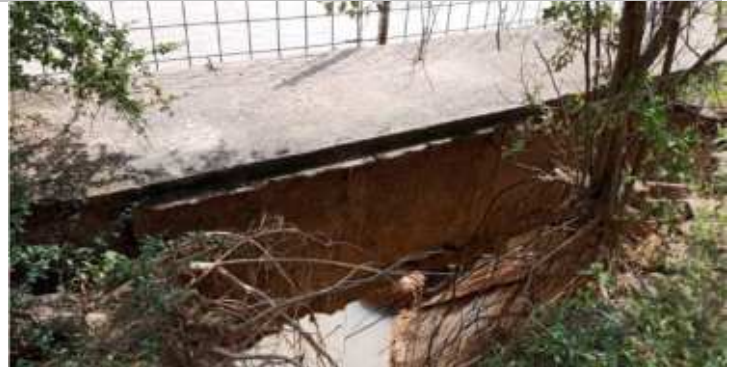
Une vue partielle de l'effondrement de la berge

Le deuxième grand défi, est la question énergétique. Dans une structure hospitalière, quand il n'y a pas une énergie en continue, la qualité de la prise en charge des patients en prend un sérieux coup. Aussi, il est important de penser aux impacts sur l'ensemble des équipements au niveau des services tels que l'imagerie, le laboratoire, la pharmacie, la chirurgie, le service des maladies infectieuses (dans lequel les patients sont parfois sous assistance respiratoire), en bref c'est globalement tout l'hôpital qui en souffre. Nous recherchons des solutions pour la conversion du système hybride en système classique. L'installation photovoltaïque faite par TTA n'a pas toujours marché.