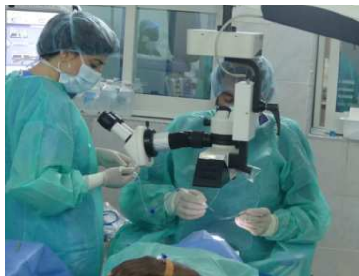
Séance d'opération chirurgicale lors de la caravane ophtalmologique par les coopérants espagnols de la Fondation Ramon Marti