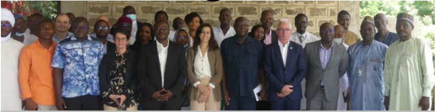
Photo de famille de la délégation conjointe du Fonds Mondial et du Ministère de la Santé publique et de la prévention dans le cadre du suivi des subventions pour la prise en charge du Paludisme et la lutte contre la tuberculose, les hépatites et le VIH/SIDA au CHU-BS.

tenaires, des bénéficiaires y compris les populations du 9 ème arrondissement. La nécessaire restauration de la berge reste ainsi pour nous un cri d'alarme et peut-être le plus grand cri. Nous devons trouver une solution car le problème est tel que le CHU-BS seul ne peut pas le ressourdre.