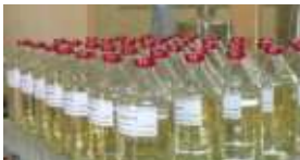
Un échantillon de solutés produit au Labo Galénique