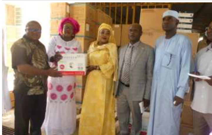
Don de médicaments au CHUBS par Madame la Secrétaire d'Etat à la santé accompagnée du Secrétaire Général du Ministère de la Santé Publique et de la Prévention