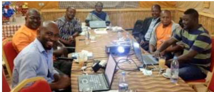
L'équipe du conseil de direction du CHU-BS en séance de relecture du plan stratégique 2025-2034

Un autre travail aussi à saluer est celui du Centre Intégré des Services Multisectoriels (CISM). Depuis l'ouverture de ce centre avec l'appui de l'UNFPA, le CHU-BS a accueilli, accompagné, et pris en charge de façon holistique environ 200 personnes. Et