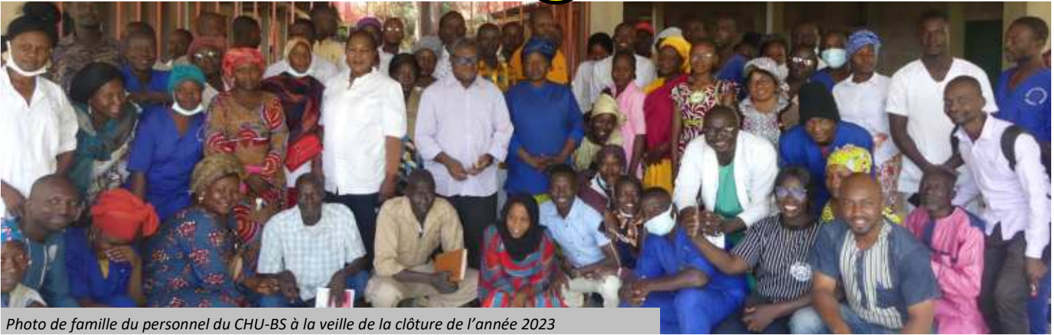
Photo de famille du personnel du CHU-BS à la veille de la clôture de l'année 2023