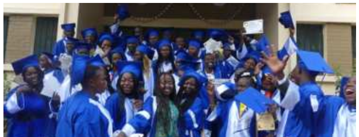
Réjouissance des étudiants de l'école de santé du CHU-BS lors de la cérémonie de remise des parchemins