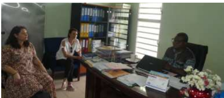
Visite de la Chargée de projet de l'Agence Italienne de la Coopération pour le Développement au CHU-BS dans le cadre du suivi des projets financés par l'AICS

L'un des plus grands défis du CHU BS actuellement c'est la question de la reconstruction de la berge. Cela fait 3 ans que cette berge a amorcé un processus d'effondrement auquel nous assistons impuissamment. Les alertes ont été lancées et nous continuerons de tendre la main. Si nous avons un débordement comme celui de 2021, il n'est pas sûr que l'hôpital résiste. Toute la communauté du CHU doit en prendre conscience : quand nous parlons de la communauté, il s'agit des employés certes, mais aussi des par-