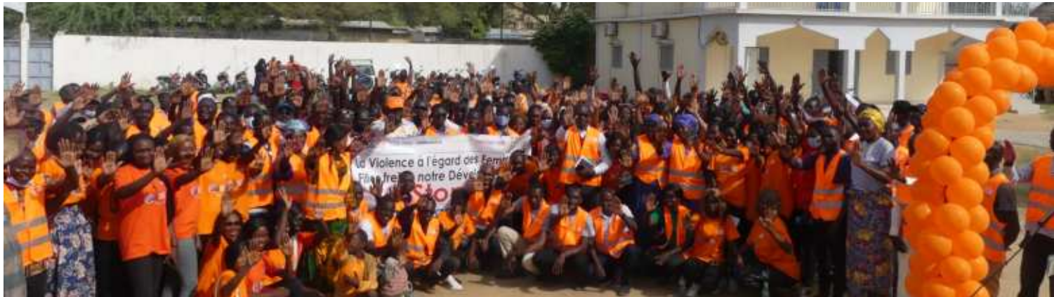
Photo de famille lors de la clôture des 16 jours d'activisme (déc.2023) contre les Violences Basées sur le Genre (VBG) organisés par les 04 Centres Intégrés de Services Multisectoriels (CISM) de la ville de N'Djamena.