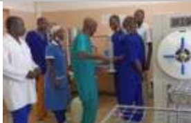
Formation à la production des solutés et bétadine

Notre satisfecit pour l'année 2023, c'est aussi la continuation du développement de la coopération pour la santé et la recherche. Durant l'année, plusieurs coopérants médecins et infirmiers ont séjourné au sein de notre hôpital et du pôle formation pour la prise en charge des patients, mais également, pour la formation des étudiants en médecine et en soins infirmiers. Les coopérants qui viennent en appui, proviennent des institutions aussi bien des pays du Nord que du Sud ; nous pouvons citer l'Université catholique du Chili, les Fondations MAGIS, RAMON Marti (Institut Catalan de la Rétine), l'hôpital Puerta del Mar de Cadix, l'hôpital Clinic de Barcelone, l'Université de Rome Tor Vergata, l'Université de Reims, l'Université Evangélique du Cameroun, le Centre International de recherche Chantal Biya. Dans la perspective de ces coopérations, nous avons reçu la