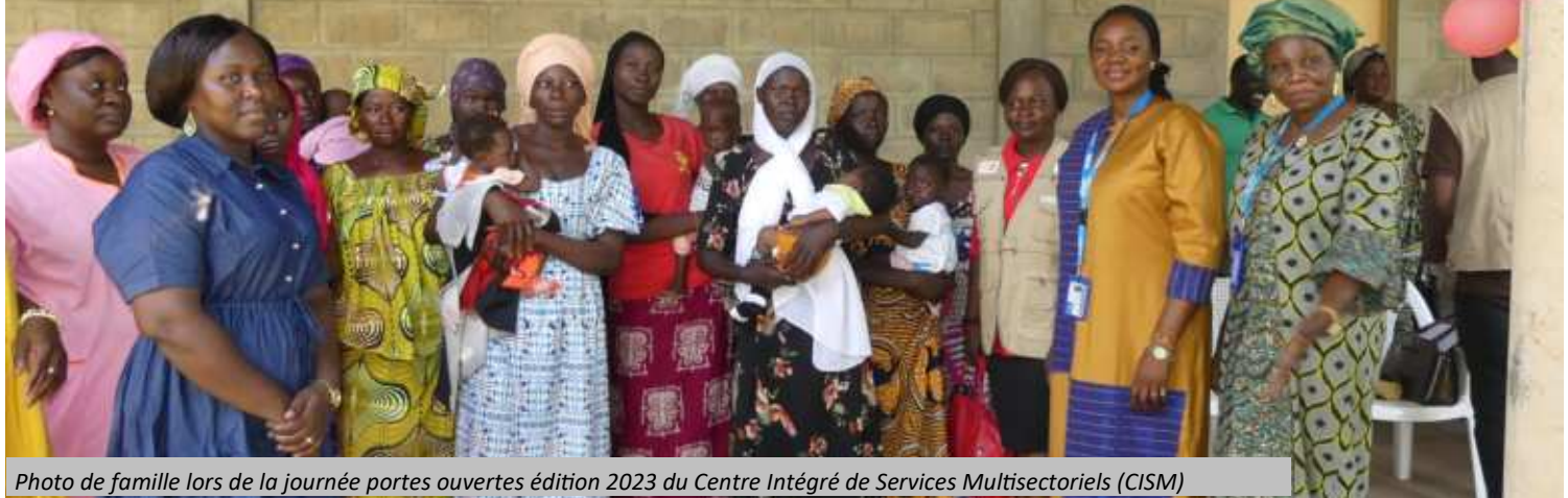
Photo de famille lors de la journée portes ouvertes édition 2023 du Centre Intégré de Services Multisectoriels (CISM)