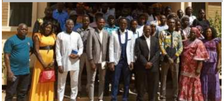
Photo de famille du staff académique avec les parents des étudiants du CHU-BS lors de la semaine d'orientation en prélude à la rentrée académique.