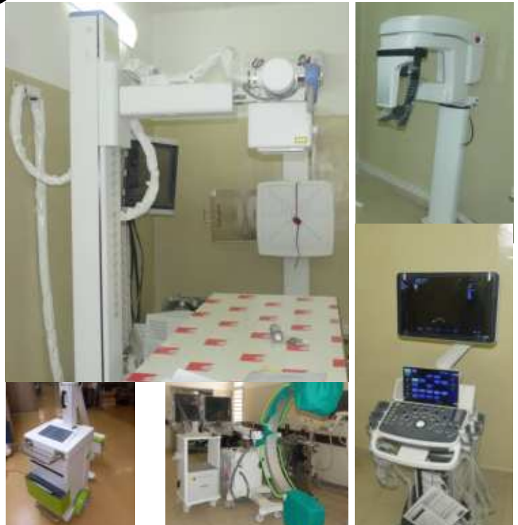
Une vue de quelques nouveaux équipements du Centre d'Imagerie Médicale et de Radiologie du CHUBS

visite du Directeur de l'Hôpital des Caméliens au Burkina-Faso. Il faut continuer à développer les partenariats, il faut même les réviser quand il le faut pour les rendre plus respectueux et faire de sorte que le triangle nord-sud, sud-nord puisse avoir toute sa base et tenir.