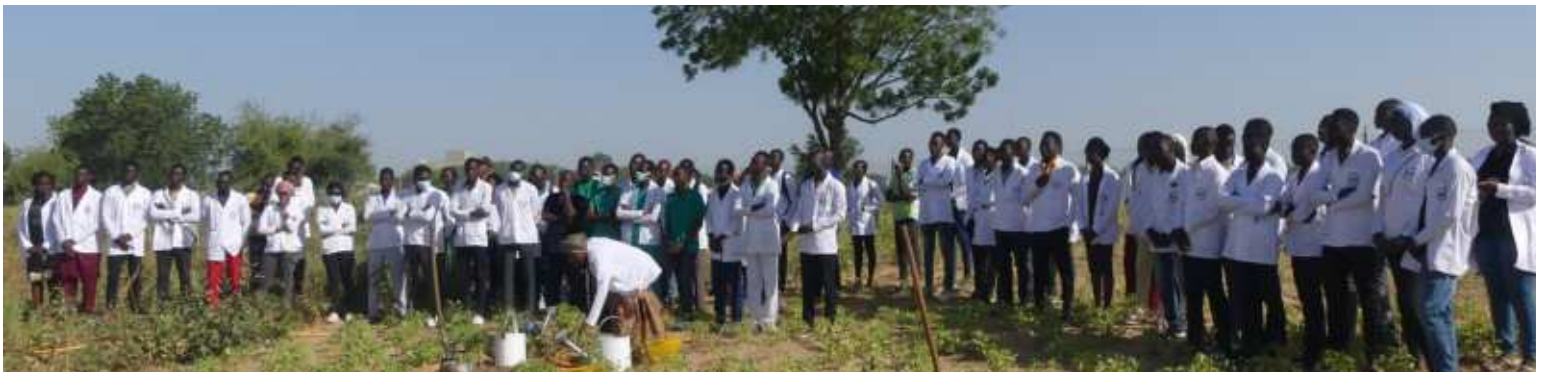
Une vue des étudiants de la faculté de médecine du CHU-BS lors du lancement du projet « Ma faculté, mon arbre »