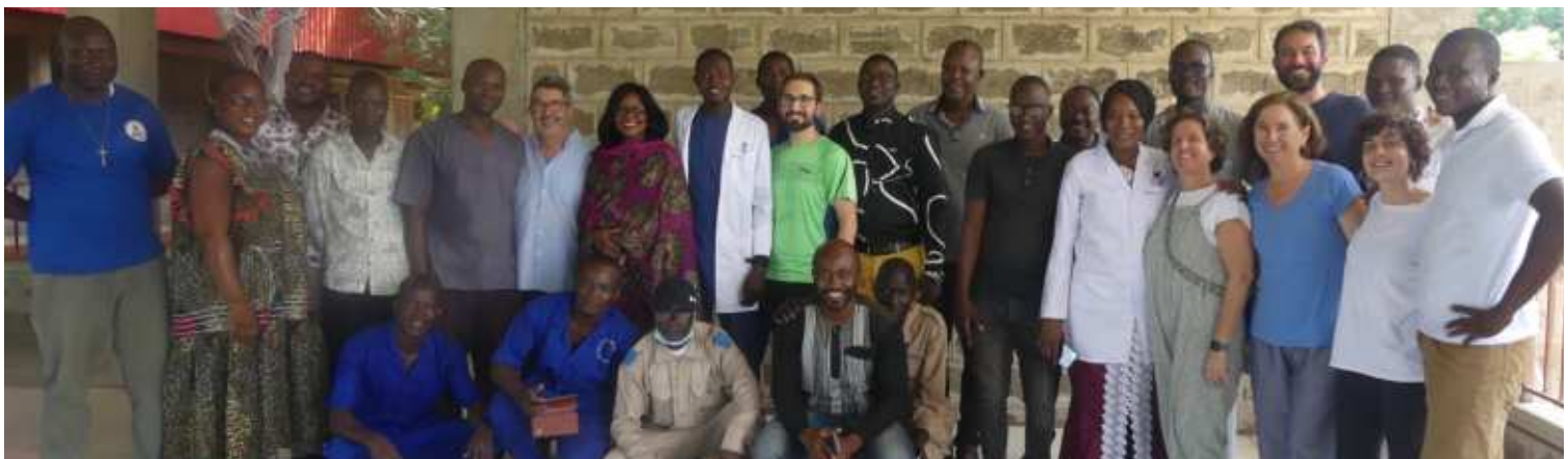
Photo de famille des coopérants en fin de leur séjour avec quelques membres du personnel pour des missions de soins et d'enseignement au CHUBS