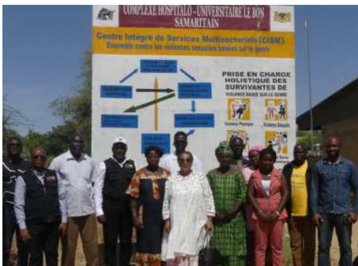
Visite de la Représente résidente de l'UNFPA dans le cadre du projet de prise en charge holistique des survivantes de VBG avec l'équipe du CHUBS/UNFPA