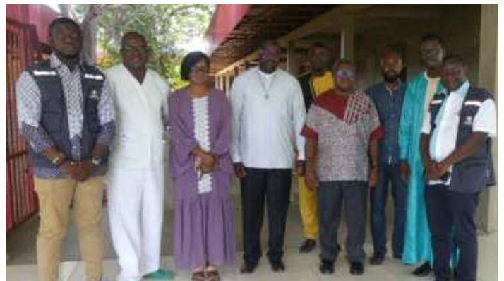
Photos de famille lors de la visite du Directeur de l'hôpital camélien du Burkina-Faso accompagné des consultants OMS et l'équipe du CHUBS

visite du Directeur de l'Hôpital des Caméliens au Burkina-Faso. Il faut continuer à développer les partenariats, il faut même les réviser quand il le faut pour les rendre plus respectueux et faire de sorte que le triangle nord-sud, sud-nord puisse avoir toute sa base et tenir.