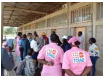
Lutte contre les Violences Basées sur le Genre (VBG): des partenaires canadiens visitent le Centre Intégré de Service Multisectoriel du CHU Bon Samaritain accompagnés de la Représentante adjoint de l'UNFPA