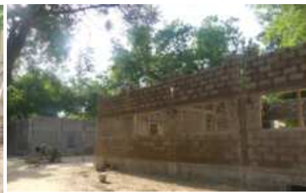
35% d'avancement général des travaux au 06/09/2020