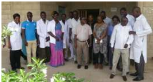
Ph. Le DG avec le personnel des Urgences du CHU-BS

De janvier à août 2019, le pavillon des urgences du Bon Samaritain a reçu 10 423 patients présentant diverses pathologies. Les accidents des voies publiques représentent 326 cas, 19 cas de brûlures, 19 cas d'intoxications aux produits toxiques. Les principales pathologies rencontrées sont notamment le paludisme avec 1193 cas, 309 cas de traumatismes, 188 cas d'infections urinaires ou encore 146 cas d'hypertension artérielle.