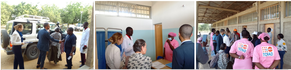
Lutte contre les Violences Basées sur le Genre (VBG): des partenaires canadiens visitent le Centre Intégré de Service Multisectoriel du CHU Bon Samaritain accompagnés de la Représentante adjoint de l'UNFPA