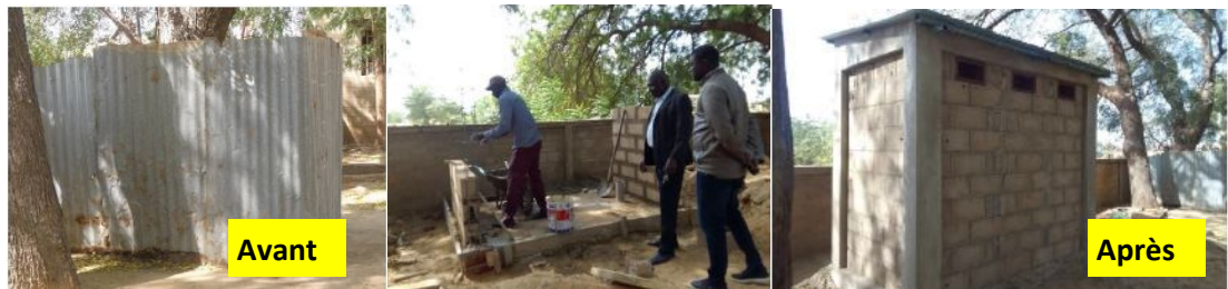
Amélioration des conditions de vie des étudiants : de nouvelles latrines construites à la faculté de médecine et de l'Ecole de santé du CHU Bon Samaritain avec l'appui des Amis du P. Carlos et ENTRECULTURAS